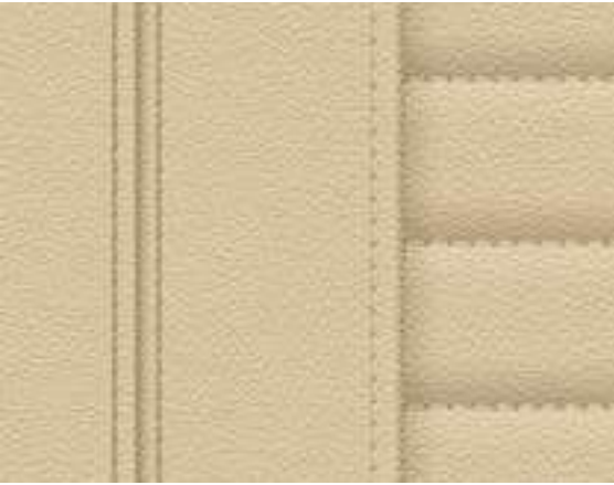
Leather Vernasca Canberra Beige with decorative stitching