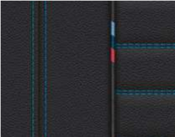
Leather Vernasca Black with contrast Blue stitching (For M40i only)