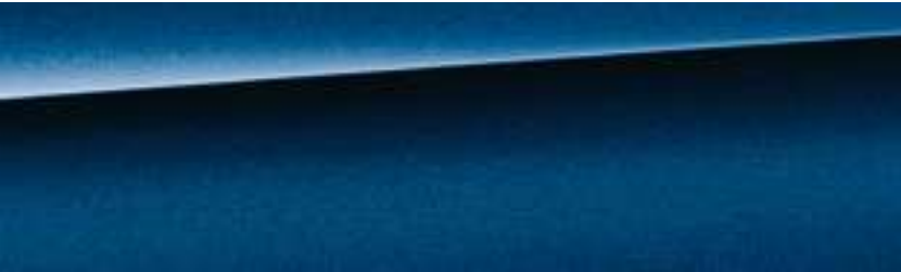
Deep Sea Blue