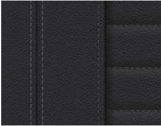
Leather Vernasca Black with decorative stitching