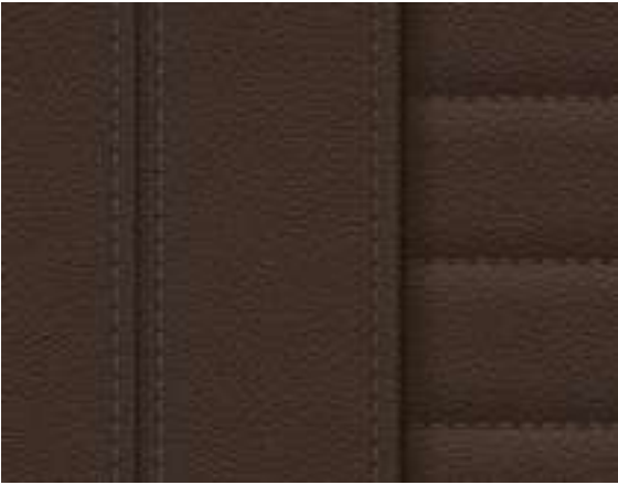
Leather Vernasca Mocha with decorative stitching