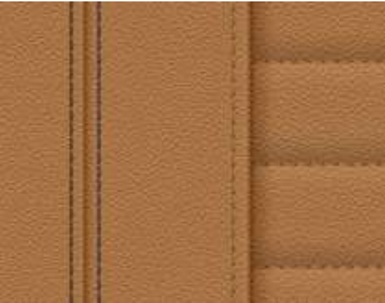
Leather Vernasca Cognac with decorative stitching