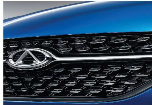
شبكة أمامية مميزة