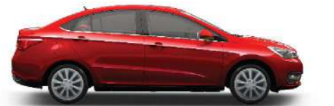
RED - أحمر