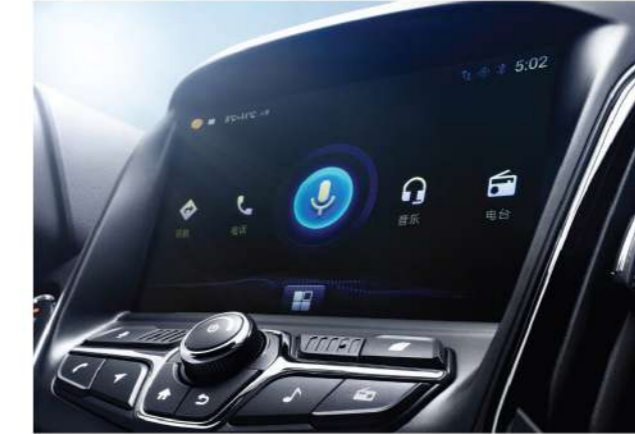
شاشة تعمل باللمس V إنش