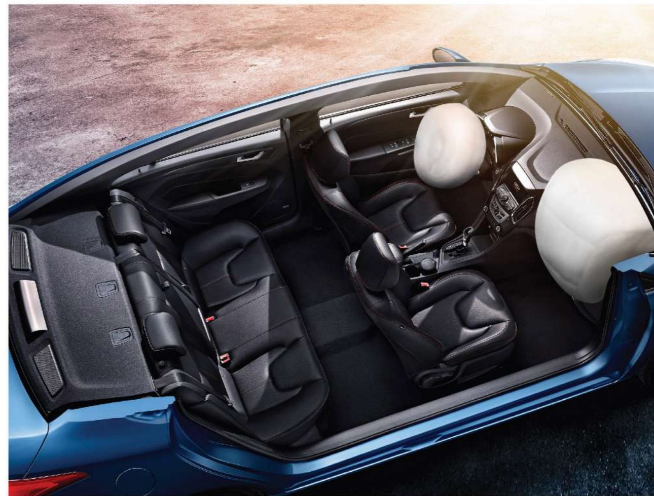
٢ وسائد هوائية