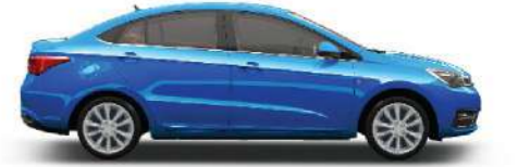
COBOLT BLUE - أزرق