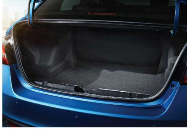
صندوق أمتعة ٤٣٠ لتر

تصميم رائع و قوي لسيارات Arrizo 5 بداية من الشبكة الأمامية حتى كابينته الركاب الواسعة بمساحات مناسبة لجميع الركاب.