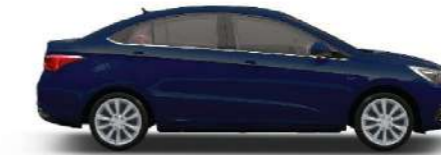
INDIGO BLUE - كحلي