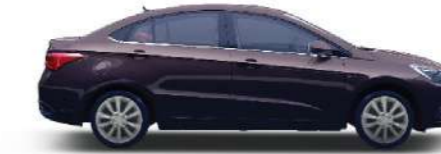
VIOLET PEARL - بازنجاني