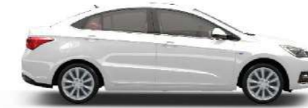
WHITE - أبيض