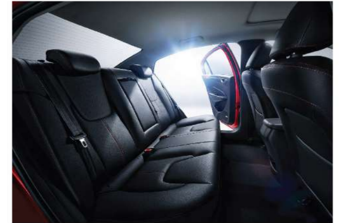
مساحات داخلية واسعة