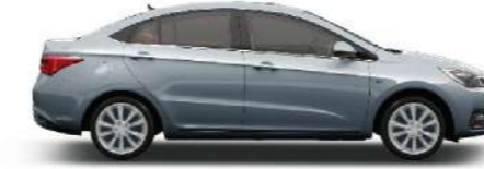
SILVER - فضي