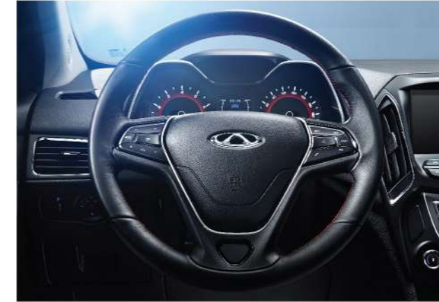
عجلة قيادة متعددة المهام