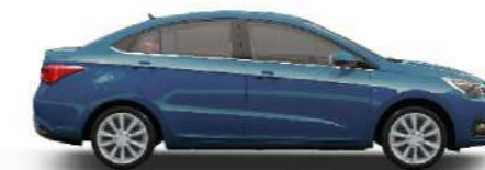
MOON LIGHT BLUE - سماوي