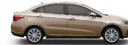
BRONZE - برونزي