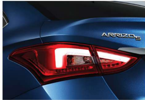
مصابيح هالوجين خلفية