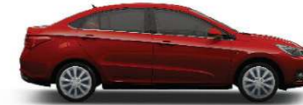
EMBER RED - نيبتي