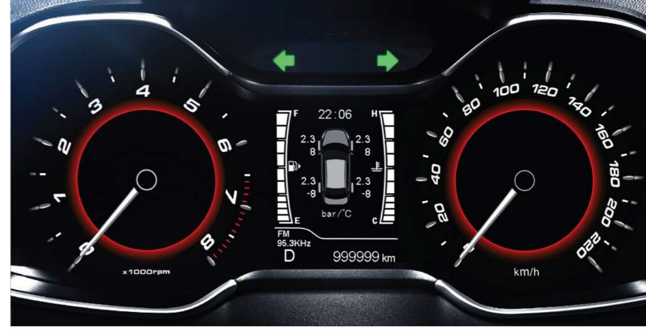
عدادات مزودة بشاشة 3,0 بوصة

تتميز هذه السيارة بالأداء العملي و الإستخدام المريح اليومي بمظهر رياضي جري يوفّر لك شعور حقيقي بمتعة للقيادة و الرفاهية