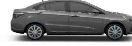
GREY - فيراني