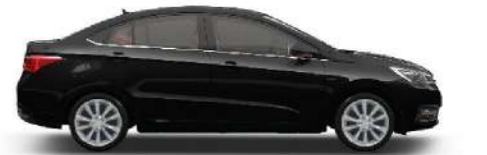
BLACK - أسود