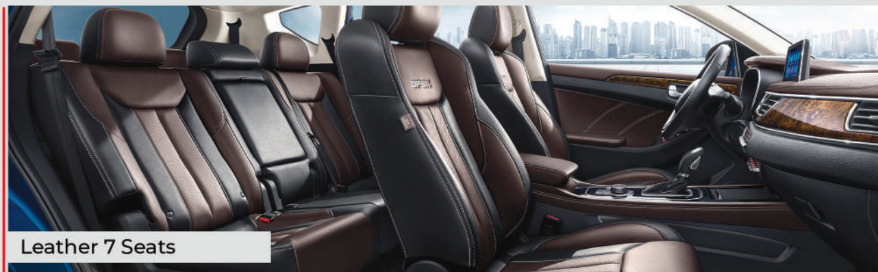
Leather 7 Seats