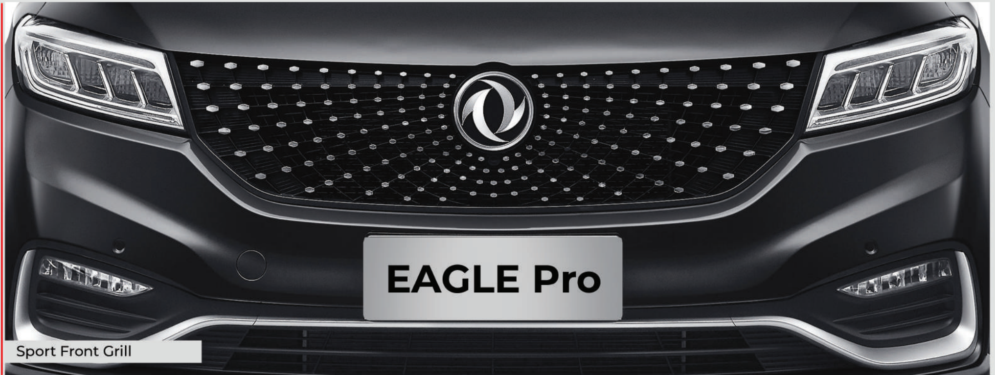
Sport Front Grill