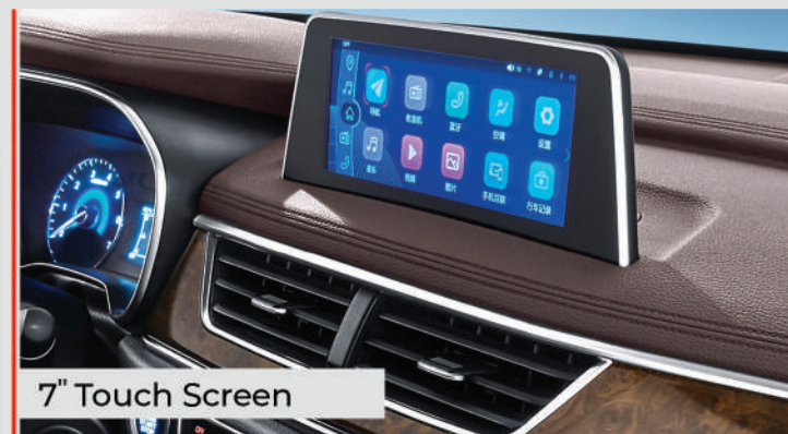
7" Touch Screen