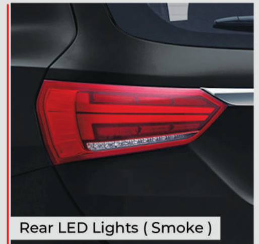
Rear LED Lights ( Smoke )