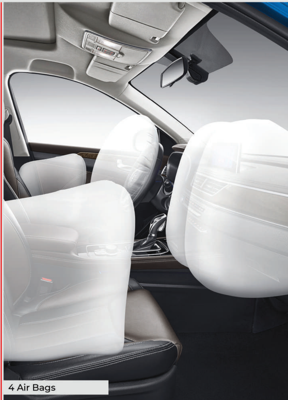
4 Air Bags