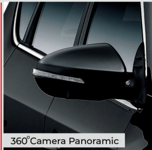
360° Camera Panoramic