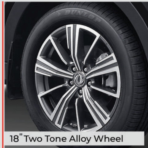
18" Two Tone Alloy Wheel