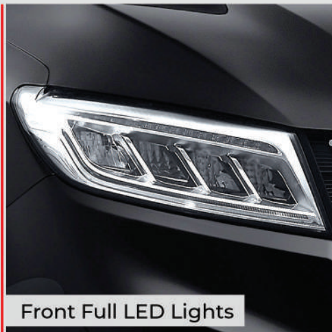
Front Full LED Lights