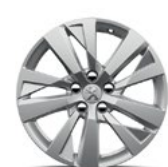
17" Alloy Chicago