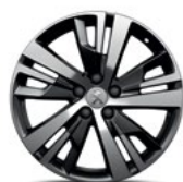
18" Alloy Detroit