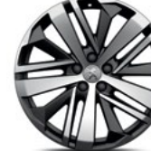
19" Boston Alloy