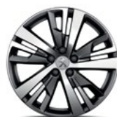
18" Alloy Detroit